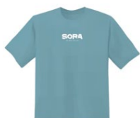
SORA Tシャツ 水色 ¥3,500 税込