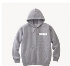
SORA ZIPパーカー グレー ¥5,500 税込