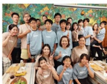
No Smile, No Life! 見学会